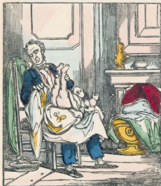
Les hommes apprendront à soigner les enfants.