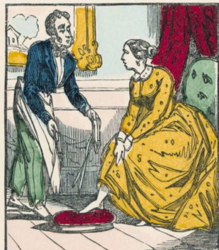
Les maris seront aux petits soins pour leurs femmes.