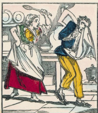
Les femmes étant les plus raisonnables, commanderont à la maison.