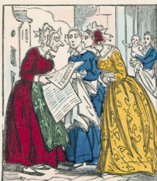
Les femmes feront les affaires et s'occuperont de politique.