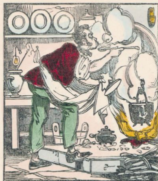
Ils feront la cuisine et éplucheront les légumes.