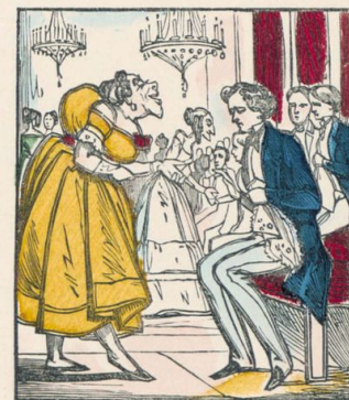
Au bal, les messieurs attendront qu'on les invite à danser.