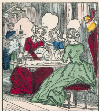
Les femmes iront à l'estaminet.