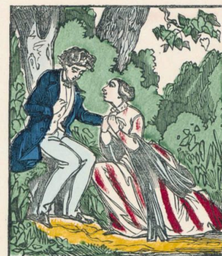
Les demoiselles séduiront les messieurs et feront des déclarations.