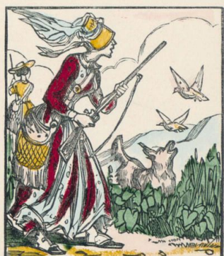
Les dames seules pourront prendre des ports d'armes.