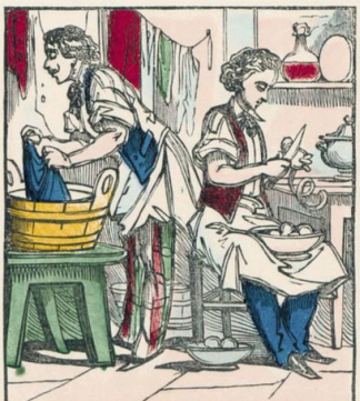
Les jeunes gens bien élevés aimeront à s'occuper de choses utiles.