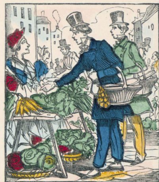
Ils iront au marché et aux provisions.