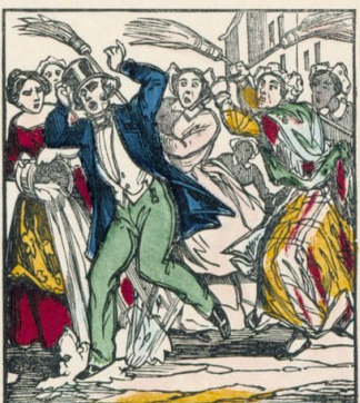
Voilà comme on traitera les garçons qui refuseraient de se marier.