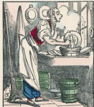
Les maris qui s'entendent bien au ménage seront très-considérés.