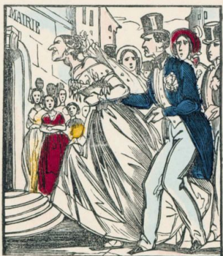
Les demoiselles choisiront leurs maris. Ces messieurs n'auront pas le droit de refuser.