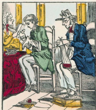
Les hommes devront savoir tricoter et raccommoder les bas.